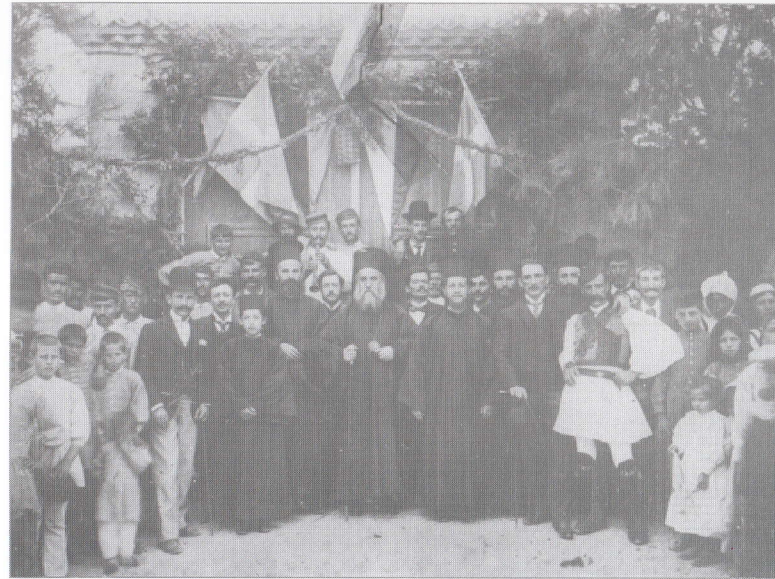
6. Sfântul Nectarie după Sfânta Liturghie, într-un sat din Evia, 1893.