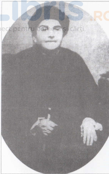
1. Mama Sfântului Nectarie